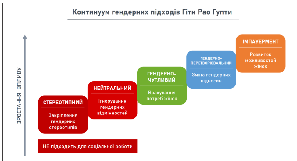
Рис. 1. Континуум гендерних підходів [12]

На наступних графіках представлено динаміку внутрішнього переміщення жінок у 2022 році