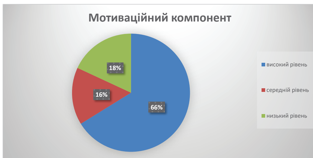
Рис. 4. Рівень професійного спрямування респондентів

Як ми можемо бачити на рис. 4 у 16% опитаних виявлено середні результати, що свідчить про те, що навчання за цією спеціальністю їм здається привабливим, вони виявляють інтерес до неї, але не впевнені, що будуть працювати у цій галузі. У 66% майбутніх та теперішніх логопедів були високі результати: студенти цікавляться навчанням, прагнуть опанувати обрану професію, постійно вдосконалюють свої знання у цій галузі, мають бажання працювати вчителями-логопедами та розвиватись у цій сфері.