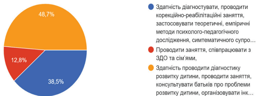
Рис. 1. Результати відповідей респондентів щодо питання «Компетентності логопеда в об'єднаних територіальних громадах»

Оскільки опитування включало студентів різних курсів і логопедів-практиків, ми вирішили запитати, чи працюють вони і де саме. За результатами відповідей можна зазначити, що лише 5,1% респондентів працюють у сільській місцевості, а 17,9% взагалі не працюють за фахом (рис. 2).