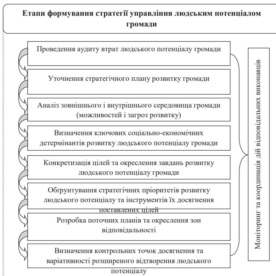
Рис. 3. Етапи формування стратегії управління людським потенціалом ТГ

Для збереження та відновлення людського потенціалу ТГ в період післявоєнної відбудови України необхідно напрацювати відповідну стратегію управління розвитком людського капіталу громади. Формування такої стратегії може здійснюватись у наступні етапи зображені на рис. 3.