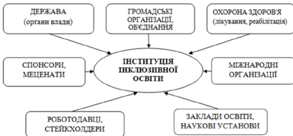
Рис. 2. Взаємодія інституції інклюзивної освіти*

Інституція інклюзивної освіти є елементом системи освіти та науки країни, а тому очевидно, що в рамках розвитку методології освіти, освітології як науки, апробації педагогічних практик, упровадження результатів наукових досліджень в освітній процес важливо змістовно та кон-