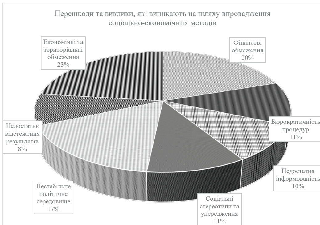
Рис. 3. Актуальні соціально-економічні методи соціальної роботи за сучасних умов