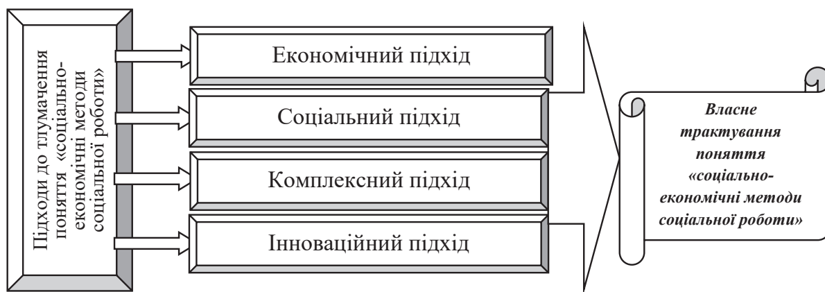
Рис. 1. Підходи до тлумачення поняття «соціально-економічні методи соціальної роботи»

Систематизація наявних підходів дозволила визначати соціально-економічні методи соціальної роботи як комплекс стратегій, програм та інтервенцій, спрямованих на забезпечення соціальної справедливості та економічної стабільності через підтримку доступу до ресурсів, розвиток економічної самодостатності, стимулювання підприємництва та підвищення економічного благополуччя вразливих груп населення (рисунок 1).